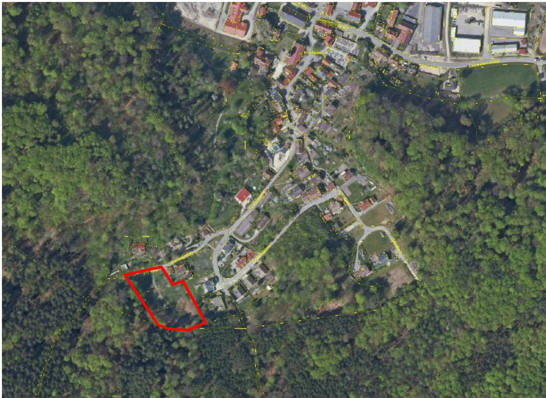
Abbildung 1: Untersuchungsraum (ohne Maßstab)

Das Planungsgebiet unterliegt derzeit keiner Nutzung. Es wird in unregelmäßigen Abständen gemäht. Es befindet sich eine dichte Gras-, Krautschicht und Brennnessel-Stauden auf der Fläche. Der direkt angrenzende Wald ist ein Buchen-Fichten-Hainbuchen-Mischbestand, wobei der direkte Waldrand dem Laubholz vorbehalten ist, die Fichten stehen aber nur unwesentlich dahinter. Vorgelagert befinden sich aktuell einige Sträucher, innerhalb des Planungsgebietes .