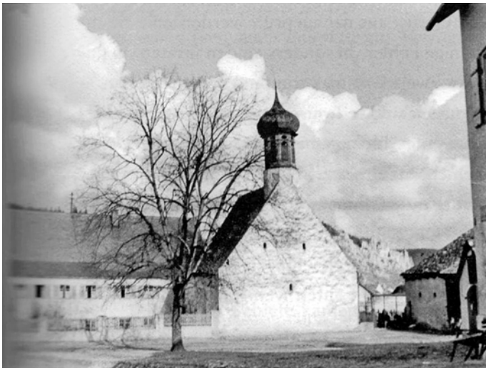
Auf diesem Foto deutlich erkennbar: Der Zugang zur Kirche erfolgte früher über den Friedhof.

Die kleine, heute evangelische Apostelkirche am Konsteiner Kirchplatz kann auf eine bewegte Vergangenheit zurückblicken: Sie wurde Ende des 16. Jahrhunderts zu einer Saalkirche überformt – als einziger sakraler Neubau in der kurzen evangelischen Zeit der Pfalzgrafschaft Neuburg (1543 – 1546 und 1550 – 1615), zu der der Ort politisch gehörte. Denn Anfang des 17. Jahrhunderts war Pfalzgraf Wolfgang Wilhelm, und damit auch das Kirchlein, schon wieder katholisch geworden. Zum Teil wurden für den Bau Steine der Konsteiner Burg verwendet, von der heute nur noch Fragmente sichtbar sind.