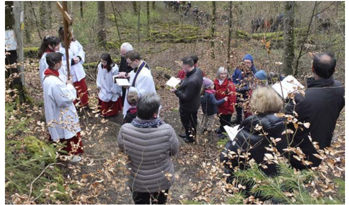
Bericht und Foto: Stefan Meyer

Trotz eines kurzen Regeschauers machten sich am Karfreitag über hundert Gläubige zusammen mit Pfarrer Johannes Huber auf den Weg zur Kreuzelbergkapelle oberhalb von Wellheim, um an den 14 Station auf dem Kreuzweg dem Leiden und Kreuzigung Christi zu gedenken.