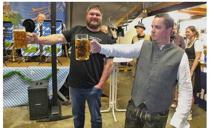
Bericht und Fotos: Stefan Meyer