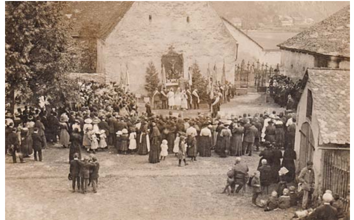
Ein Festgottesdienst im Freien im Jahr 1923 vor der damals noch katholischen Kirche.

Anfang der 2000er Jahre vergrößerten sich, bedingt durch Bauarbeiten an Straße und Kanal sowie sehr trockene Sommer, vorhandene Risse im Mittelmedaillon und über dem Altar. Deshalb folgten 2005/06 aufwändige Renovierungsmaßnahmen, bei denen neue Balken in den Dachstuhl eingezogen, Lasten verteilt und lose Stuckteile wieder fixiert wurden sowie das Hängewerk reaktiviert wurde.