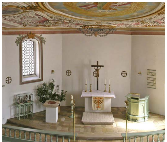
Der Innenraum der Apostelkirche mit schlichtem Altarraum und Christusbild an der Decke.

Text: Melanie Puis-Obel