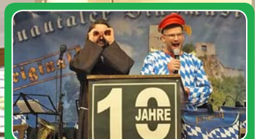
Starkbierfest im Bauhof Seite 30-31