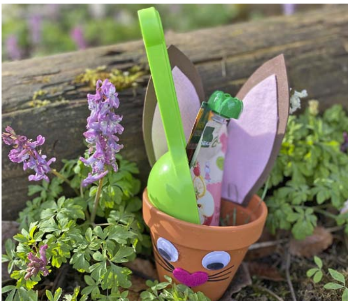
Bericht und Fotos: Manuela Peichl