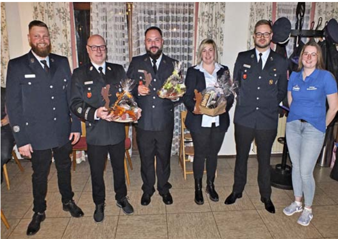
Die scheidenden Vorstandsmitglieder und ihre Nachfolger der Feuerwehr Konstein