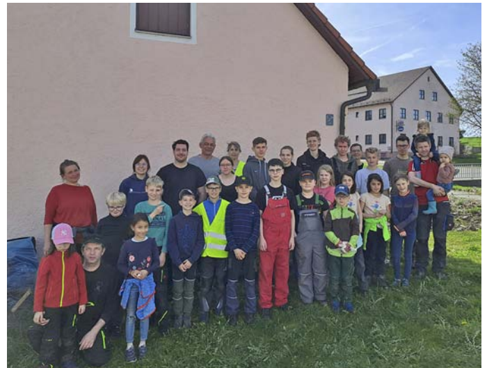
Text und Foto: Maria Maile

Die Aktion wurde von der Freiwilligen Feuerwehr durchgeführt.