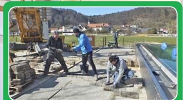
Wiedereröffnung Schutterbad Seite 42-43