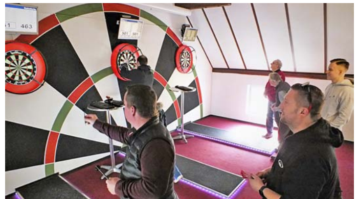
Reges Interesse am Dartsport gab es bei der Eröffnung des Vereinsheimes der Urdonau Darter Wellheim in Aicha.

Wer sich für den Dartsport interessiert, hat jeden Freitag beim freien Dart-Training die Möglichkeit reinzuschnuppern und sich beim Stammtisch auszutauschen. Darüber hinaus werden die Förderung und Unterstützung bei der Verbesserung des Könnens angeboten. Geplant für die Zukunft ist eine Jugendförderung durch ausgebildete Trainer und Ausflüge zu bestimmten Dartevents. Für Fragen und nähere Informationen steht der Vorstand unter der Telefonnummer (0170) 2183831 gerne zur Verfügung.