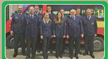
Feuerwehr Wellheim Jahres- hauptversammlung Seite 22

Jahrgang 9 | Samstag, 27. April 2024 | Ausgabe 2