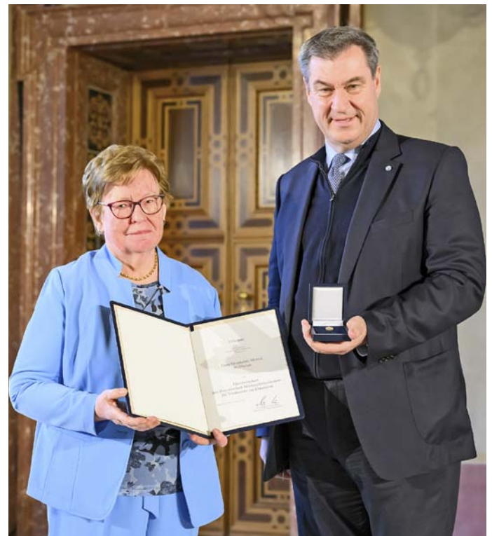
Die Ehrung/Auszeichnung fand am 18. März 2024 in München statt.

Das Ehrenzeichen des Bayerischen Ministerpräsidenten für Verdienste von im Ehrenamt tätigen Frauen und Männern wird seit 1994 als ehrende Anerkennung für langjährige hervorragende ehrenamtliche Tätigkeit verliehen. Es erhalten Personen, die sich durch aktive Tätigkeit in Vereinen, Organisationen und sonstigen Gemeinschaften mit kulturellen, sportlichen, sozialen oder anderen gemeinnützigen Zielen hervorragende Verdienste erworben haben. Die Verdienste sollen vorrangig im örtlichen Bereich erbracht worden sein und in der Regel mindestens 15 Jahre umfassen.