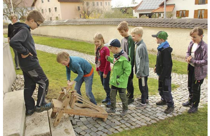
Bericht und Foto: Theresia Asbach-Beringer

In Biesenhard fanden sich die Kinder an den beiden Kartagen zusammen, um nach altem Brauch jeweils um 12 und 15 Uhr anstelle des Glockengeläuts zu ratschen. Dazu war allerhand Muskelkraft gefragt, doch die Mädchen und Buben schafften es mit Bravour.