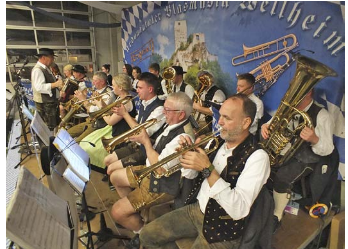
Die Original Urdonautaler Blasmusik Wellheim unterhielt beim Starkbierfest mit traditionellen Musikstücken.